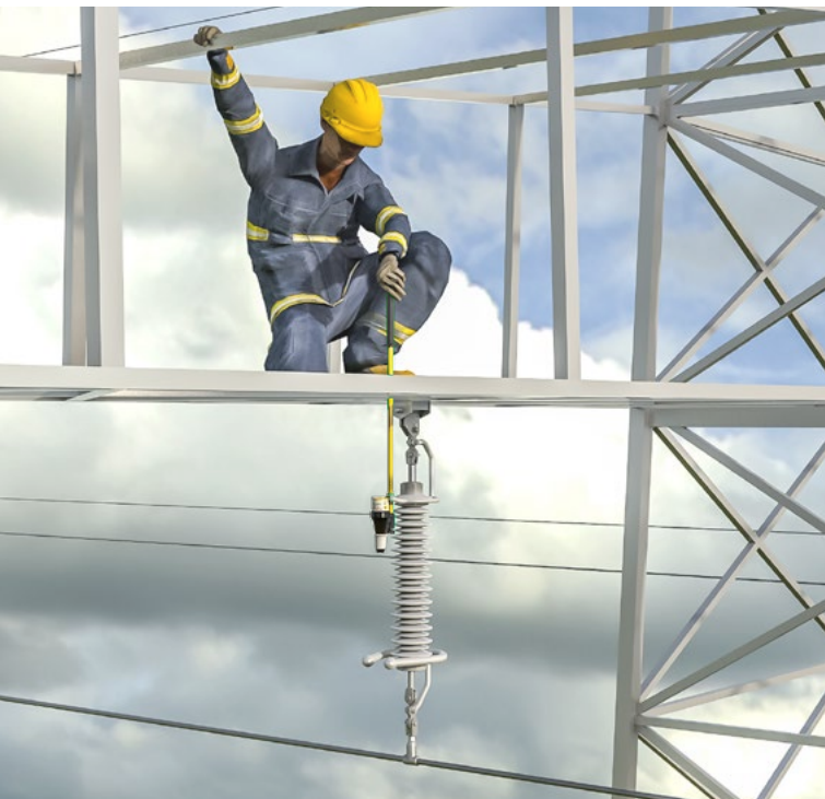
Der KP-Test 5D dual prüft hohe Spannung an Freileitungen in Bahn- und EVU-Bereich.

Mit unter einem Meter Gesamtlänge und einem Gewicht von 1.080 Gramm ist der KP-Test 5D dual in jeder Situation einfach zu handhaben. Egal ob im Einsatz auf dem Mast oder beim Transport in der ergonomischen Tasche mit Schultergurt. Damit bietet der Spannungsprüfer auch ein weiteres Plus an Sicherheit im täglichen Gebrauch.