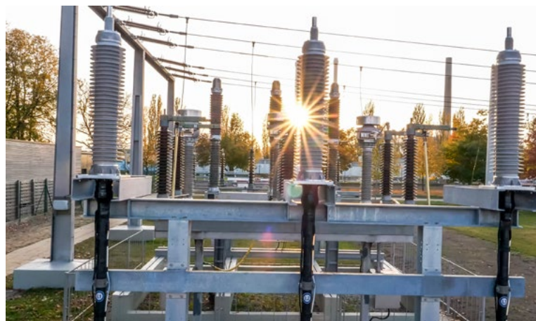
Szybki i bezpieczny – montaż w ekologicznej technologii